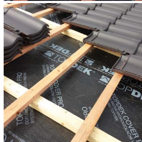
Tabulka 01 | Konstrukční typy DHV z asfaltového pásu TOPDEK COVER PRO